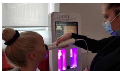
Diagnostic de peau numérique avec le IOMA Link