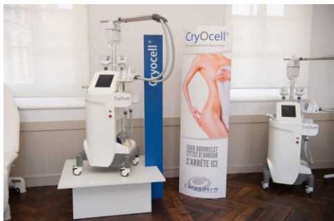
Le Showroom Hi-Tech Corpoderm

Les Starts Up de la Fabrique de la Beauté de Chartres Métropole - La Cosmetic Valley